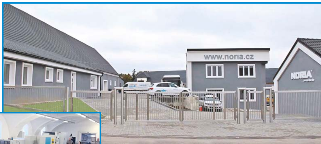
Výrobní areál společnosti NORIA v Tavíkovicích