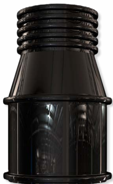
Ukončovací šachta 800/1300 BD samonosná