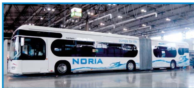
NORIA BUS pro veletrhy a výstavy