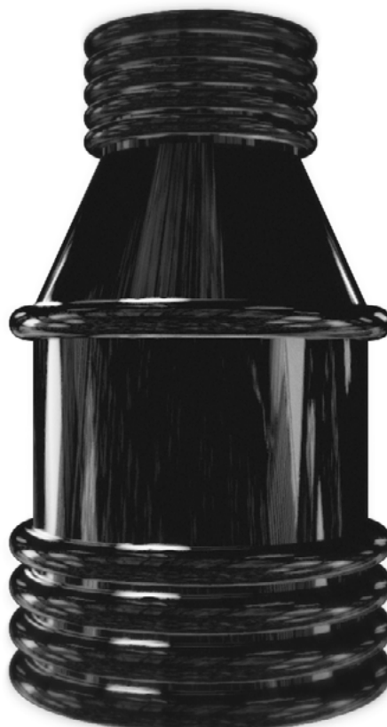
Kanalizační šachta 1000/2000 samonosná