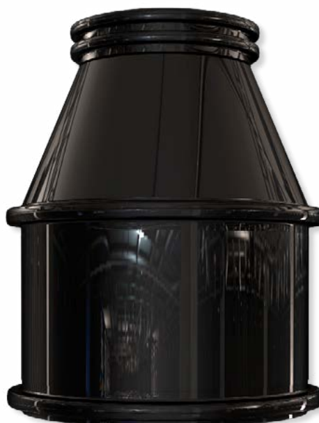
Vodoměrná a ukončovací šachta 1000/1300 samonosná