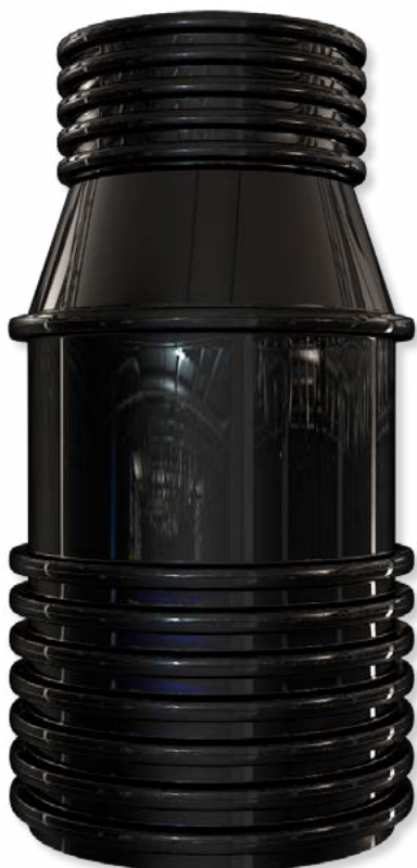
Kanalizační šachta 800/2000 samonosná